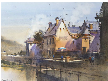
Prafull Sawant Paysage sur le motif en Normandie