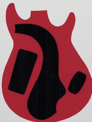
Schéma à reproduire. Photocopiez-le en l'agrandissant pour garder les proportions.