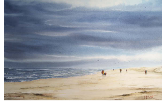
Détente océane. 46 x 64 cm.