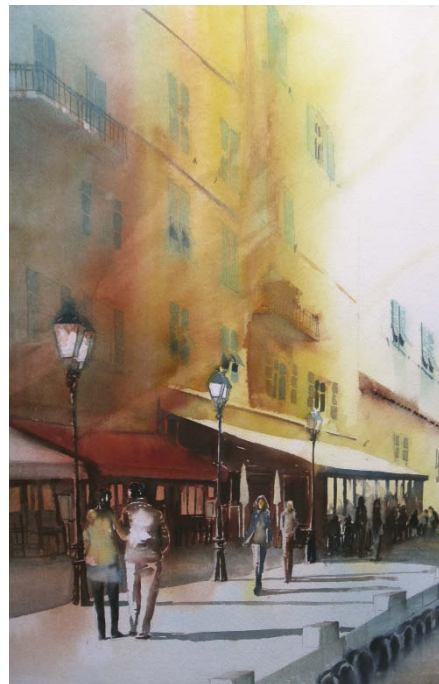
Le Rien dévoilé. 2012. 73 x 60 cm. © jbeyst.