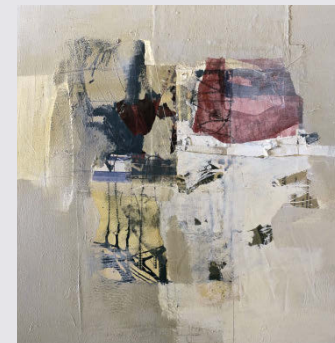
KATHERINE CHUNG LIU Des peintures abstraites en technique mixte qui font preuve d'un sens aigu de la beauté.