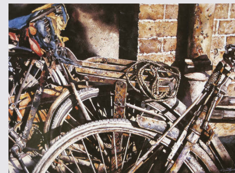
STEPHEN YAU Cet artiste canadien révèle sa passion pour les détails qui suggèrent le passage du temps.