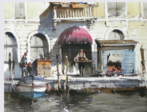
CORNELIU DRAGAN-TARGOVISTE Ses paysages urbains déploient une simplicité des formes et des espaces mis en valeurs par une lumière transparente.